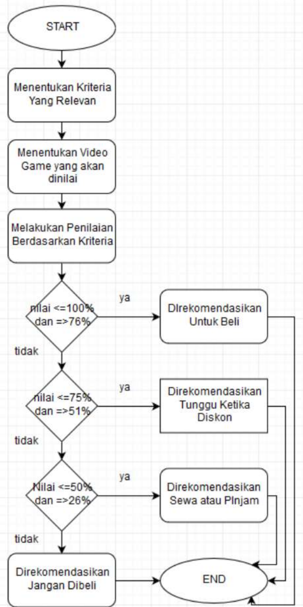
Gambar 2 Desain Framework

Penelitian ini bertujuan untuk memberikan rekomendasi apakah Video Game yang akan dimainkan pantas untuk dibeli, dibeli ketika diskon, disewa atau dipinjam, atau tidak dibeli seperti yang dijelaskan pada gambar berikut: