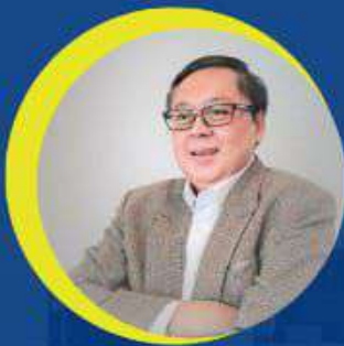
TRIYONO GANI KEPALA GROUP INOVASI KEUANGAN DIGITAL OJK