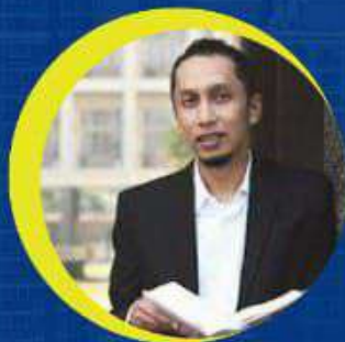
NOFIE IMAN FAKULTAS EKONOMI DAN BISNIS, UNIVERSITAS GADJAH MADA