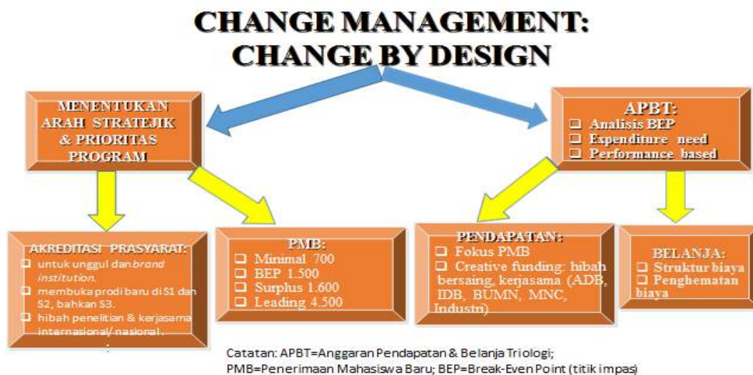
Gambar 1.4. Manajemen Perubahan Menuju Top 200 Universitas Terbaik di Indonesia

Universitas Trilogi telah menentukan tiga strategi prioritas, yaitu: akreditasi, Penerimaan Mahasiswa Baru (PMB), dan keuangan (lihat Gambar 1.3). Sub-bab berikutnya akan menjabarkan lebih rinci ketiga strategi dalam kerangka besar Manajemen Perubahan Menuju Top 200 Universitas Terbaik di Indonesia.