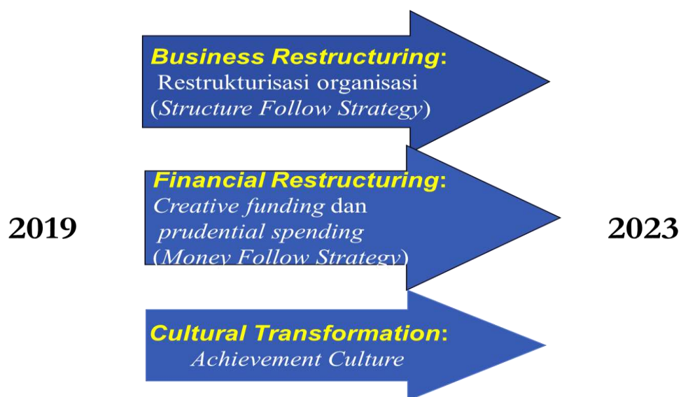
Gambar 1.3. Transforming to Top 200 Universities Indonesia